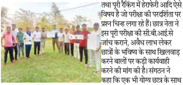
बाले योग्य छात्रों के भविष्य से खेल रहे हैं। नीट के एक ही सेंटर में से 7 छात्रों के पूरा पूर्णांक मिलना यह प्रदर्शित करता है कि वेदमांनी हुई है। विहार, गुजरात में गिरफ्तार लोगों ने बताया कि कैसे लेकर पेपर छात्रों को लीक किये गये है बड़ी मात्रा में पैसों का मिलना 67 छात्रों का पूर्णांक पाना